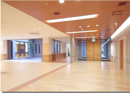
(エントランスホール)