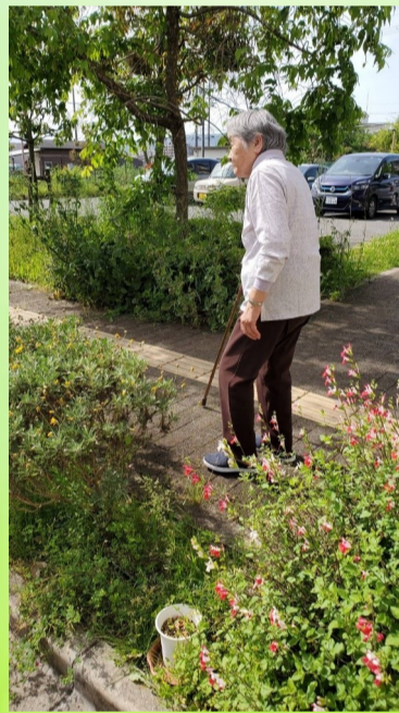
機能訓練にも力を入れて取り組んでいます！