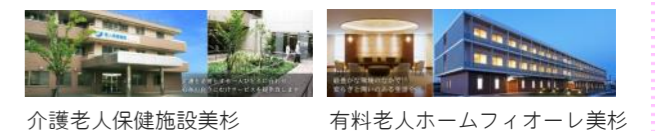
介護老人保健施設美杉

また、在宅での生活が難しくなられた場合でもグループ内には特別養護老人ホームや介護付き有料老人ホーム、グループホーム、サービス付き高齢者向け住宅など様々な施設がありますので、グループ全体で切れ目のない介護サービスが提供できる体制が整っています。