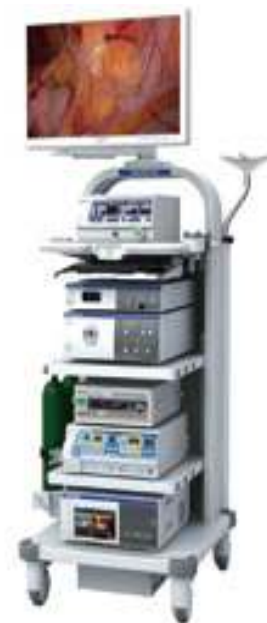
VISERA ELITE システム

当院では、最新の医療機器をもちいた腹腔鏡手術を積極的に取り入れ、患者さんの負担や影響を少なくし、早期回復、早期退院を目指しております。