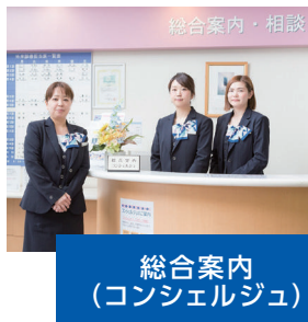
総合案内 (コンシェルジュ)